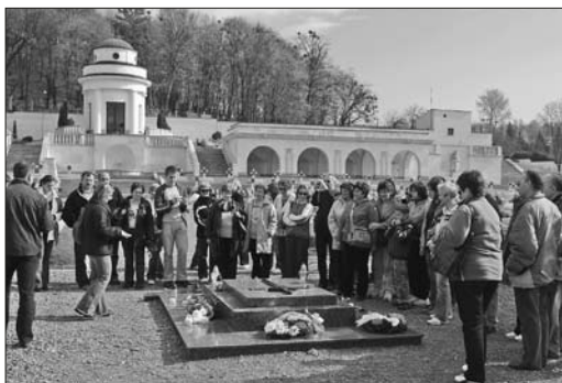
Cmentarz Orłąt we Lwowie