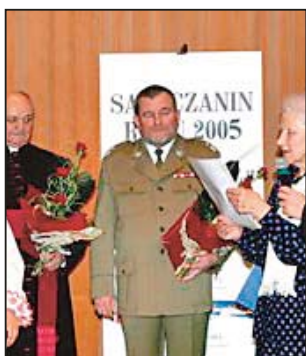
gen. Zygmunt Staniszewski